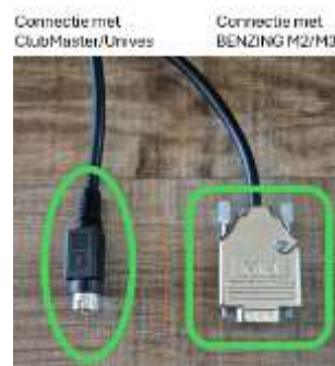
Connectie met ClubMaster/Unives

1: M1 2: Atis Top, Atis Express 3: M1 Station, Express G2, M2, M3