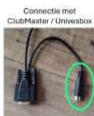
Connectie met ClubMaster / Univesbox