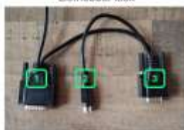
Connectie met Liefhebber klok

1: M1 2: Atis Top, Atis Express 3: M1 Station, Express G2, M2, M3